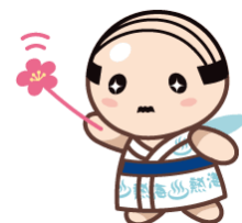
熱海温泉ホテル旅館協同組合 公式キャラクター あつお